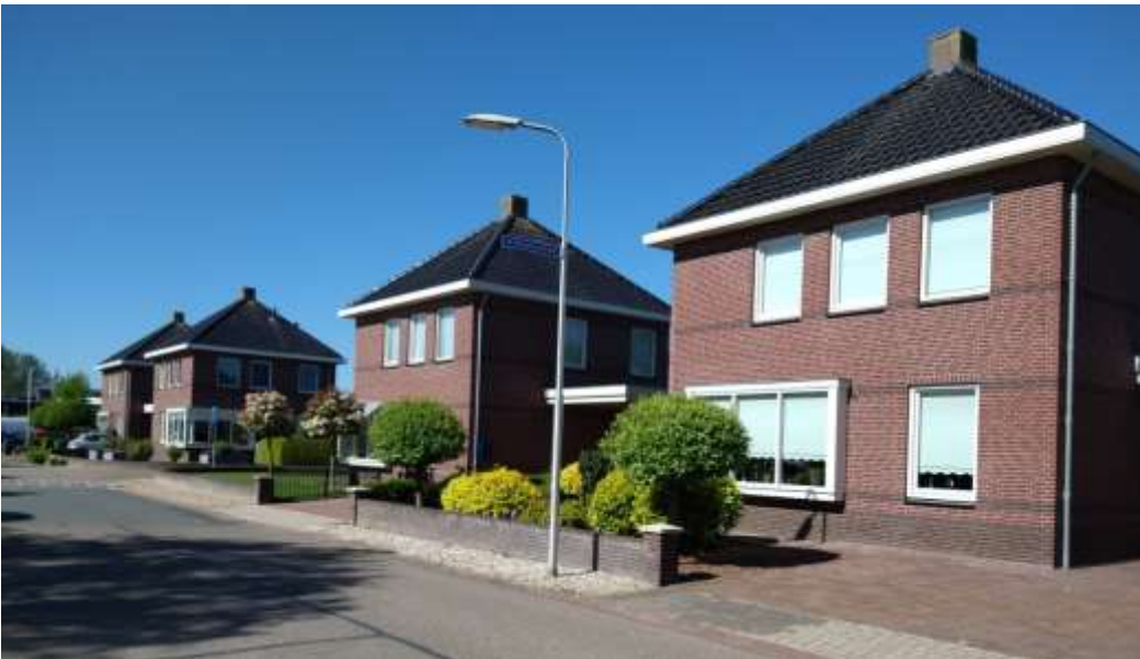
Nieuwbouwhuizen uit bouwjaar 2005 .....

In 2002 is huis en schuur gesloopt om in 2005 plaats te maken voor een deel van de negen nieuwbouwhuizen aan de Sportlaan